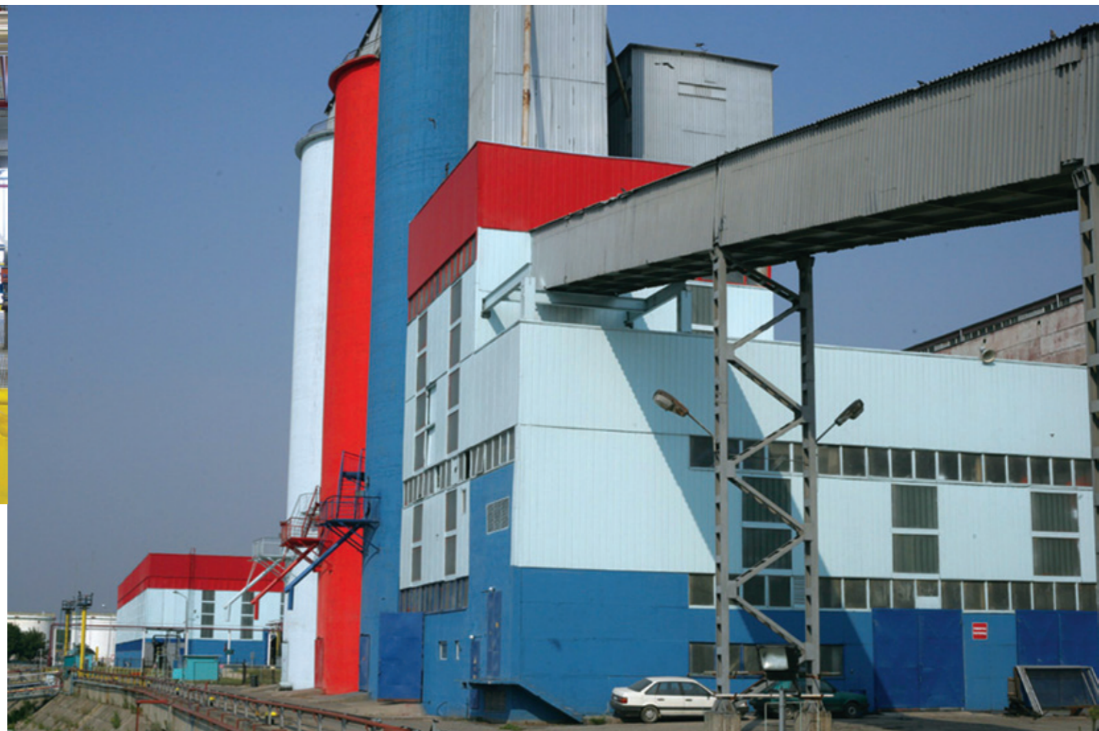
2 Бумаркет ДМ ООД – Русе. Завод за растителни масла. Bulmarket DM Ltd, Rousse. The plant for vegetable oils.