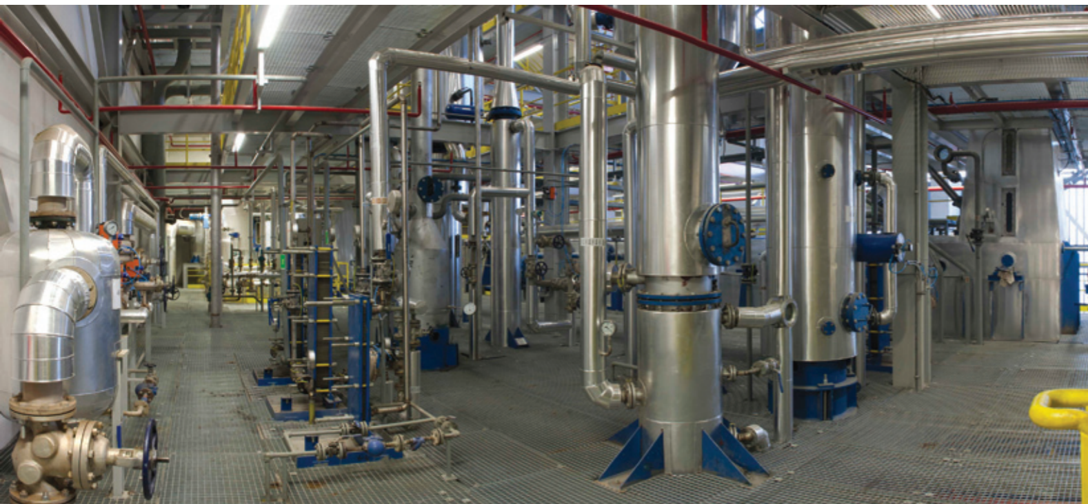
1 Бумаркет ДМ ООД – Русе. Инсталация за екстракция в завода за растителни масла. Bulmarket DM Ltd, Rousse. Installation for extraction at the plant for vegetable oils.