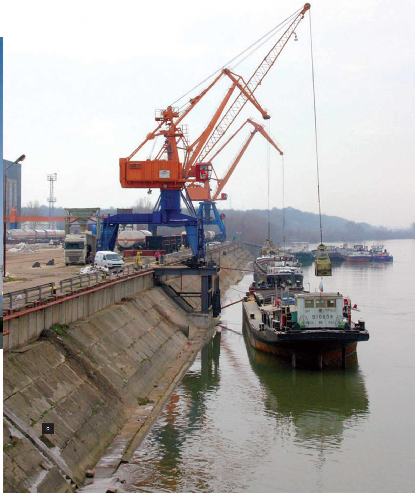
1. Булмаркет ДМ ООД – Русе. Резервоари за съхранение на растителни масла. Bulmarket DM Ltd, Rousse. Storage tanks for vegetable oils. 2. Булмаркет ДМ ООД – Русе. Порт „Булмаркет“. Bulmarket DM Ltd, Rousse. Port Bulmarket on the Danube.