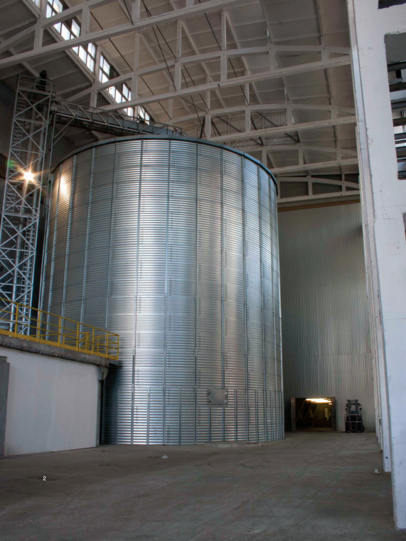
1. Булмаркет ДМ ООД – Русе. Изглед от пристанищния комплекс. Bulmarket DM Ltd, Rousse. View from the port complex.