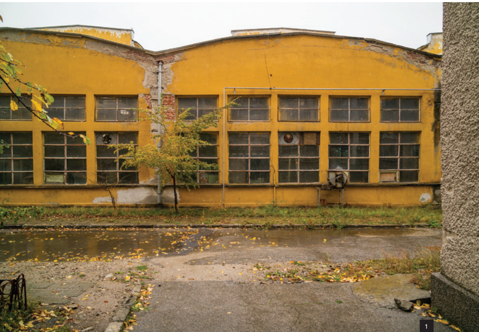
1. Building of the machine shop, former armory, Samokov Сградата на механичния цех във фирма „Самел 90“ (бивш военен завод „Христо Ников“), Самоков 2. Machine shop, former armory, Samokov Механичен цех, фирма „Самел 90“, част от бившия военен завод „Христо Ников“, Самоков