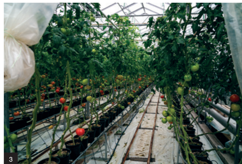
3. Tomato-growing greenhouse, former armory, Samokov Оранжерия, фирма „Самел 90“, част от бившия военен завод „Христо Ников“, Самоков 4. Building of metal storage, former armory, Samokov Склад метали, фирма „Самел 90“ (бивш военен завод „Христо Ников“), Самоков