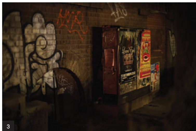
1. Noema Art Gallery, Sofia Галерия „Ноема“, София 2. Graffiti in the garden behind the building of St Cyril and Methodius National Library, Sofia Графити в градинката зад Националната библиотека „Св. Кирил и Методиус“, София